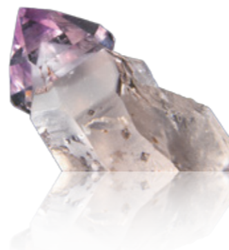
Une améthyste sceptre du Beaufortain

Exposition permanente. Entrée libre, tous les jours de 9h à 19h.