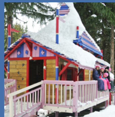
Le nouveau Village des enfants à Courchevel 1850