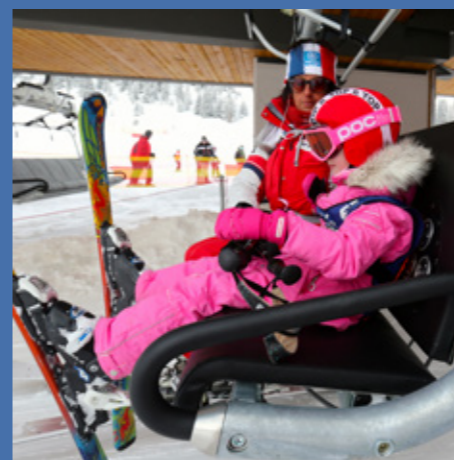
Un télésiège équipé du Magnestick Kid