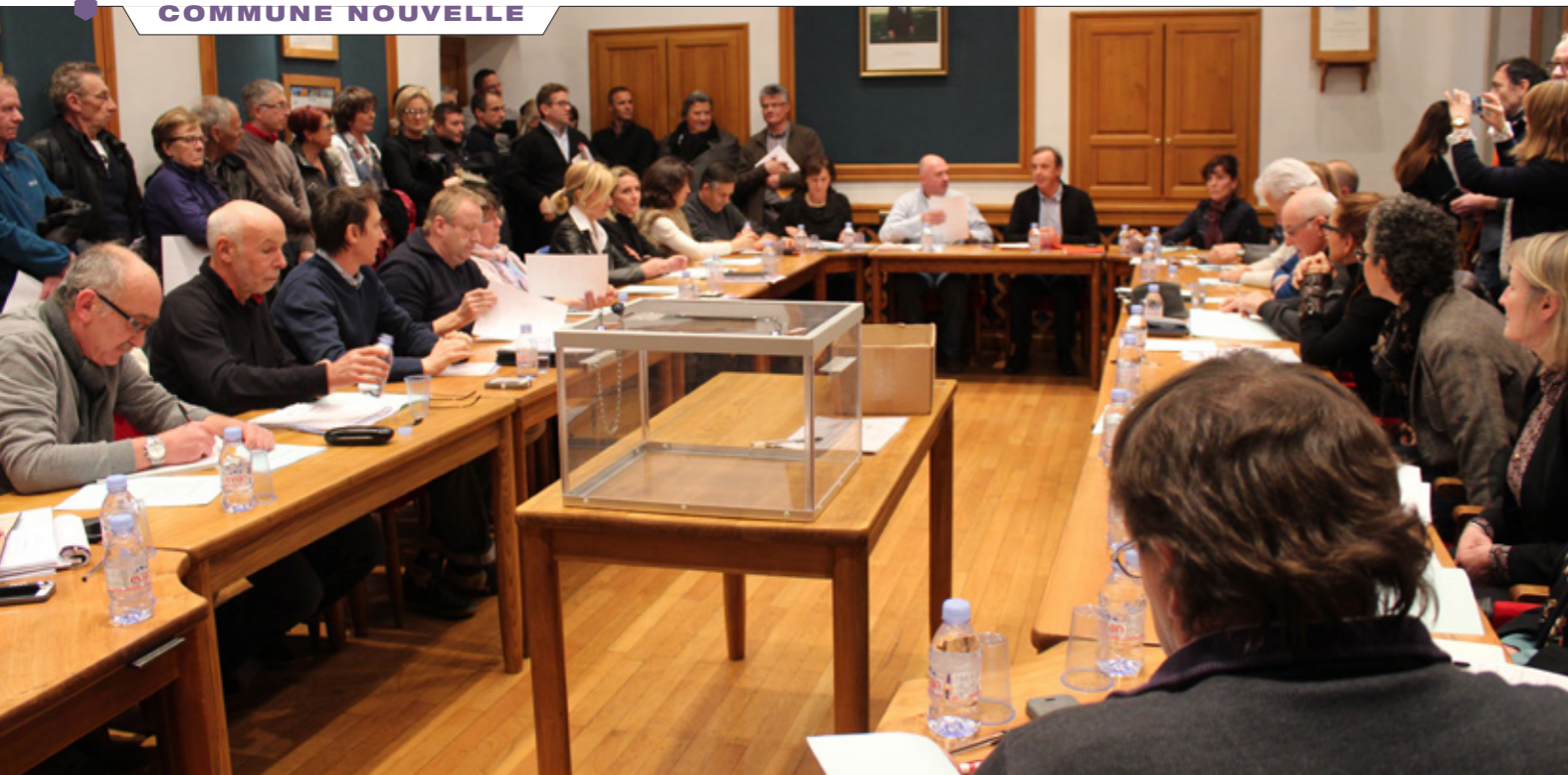
Premier Conseil municipal de la commune nouvelle de Courchevel : une trentaine d'habitants ont assisté à cette séance historique.