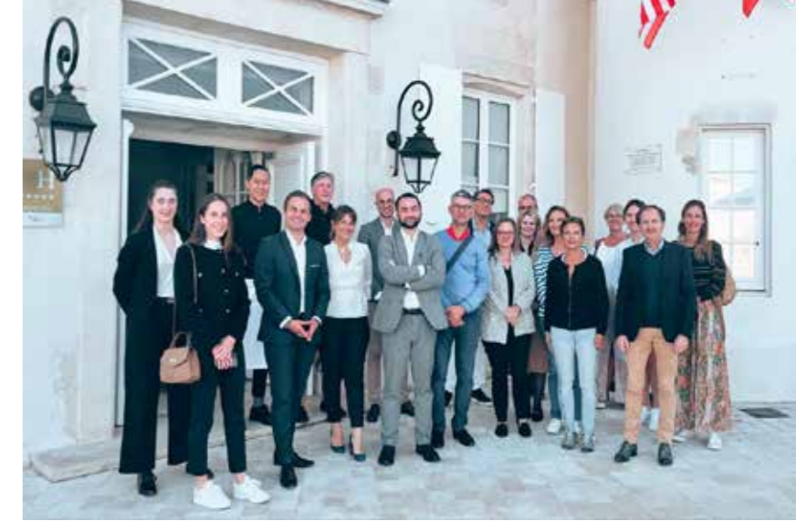
VISITE DE L'ÉQUIPE DE COURCHEVEL À L'HÔTEL DE THIORAS 5* À L'ÎLE DE RÉ

Cet automne, l'équipe de Courchevel Emploi a organisé plusieurs salons de l'emploi sur la thématique de l'hôtellerie-restauration, afin d'initier des échanges entre employeurs et saisonniers.