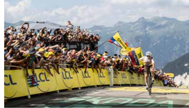
APRÈS RICHARD VIRENQUE (FRANCE) EN 1997, MARCO PANTANI (ITALIE) EN 2000, ALEJANDRO VALVERDE (ESPAGNE) EN 2005, FÉLIX GALL (AUTRICHE) EST LE NOUVEAU VAINQUEUR DE LA 17 e ÉTAPE DU TOUR DE FRANCE 2023 À COURCHEVEL.

Courchevel 2046 : destination touristique écoresponsable et habitable à l'année ! Qui peut ne pas être d'accord, quoi que j'aurais préféré « où il fait bon vivre » plutôt que « habitable » qui fait un peu fin du monde. Quelle réalité par rapport au livre blanc des habitants ? Rentabilité à court terme trop orientée sur le luxe alors que les constructions luxueuses envahissent tous les niveaux ; ne plus focaliser sur le 100% ski alors que nos slogans sont « capitale mondiale du ski » et « ici c'est le ski » ; développer les autres villages plus accessibles alors que rien ne bouge à Saint Bon ; focus sur les familles françaises alors que l'O.T. part en voyages dans des pays où trouver de nouveaux riches clients ; développer l'été et l'âme montagne alors que la saison raccourcit et pététrade.